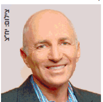
ד"ר מיקל הירון, נשיא מופ' בטבע

חברת התרופות טבע סיפקה בסוף השבוע קצת חדשות טובות למשקיעים בה, ובעיקר לחולים בדיקניזה מאוחרת. החברה דיווחה כי רשות המזון והתרופות של ארה"ב (FDA) אישרה לשווק את התרופה המקורית של טבע, Austedo, לטיפול בדיקניזה מאוחרת בקרב נגידים. זאת לאחר שבאפריל אושרה התרופה לטיפול בכוריאה הנלווית למחלת הנטינגטון. ריסקניזה מאוחרת היא הפרעת תנועה מגבילה ולעיתים קרובות בלתי הפיכה המאפיינת בתנועות חוזרות ובלתי נשלטות של האגן, השפתיים, הפנים והגפיים. לפי הנתונים שסיפקה טבע, 500 אלף איש בארה"ב מושפעים ממנה, לעיתים בעקבות נטילת תרופות מסוימות המשמשות לטיפול במחלות נפש או במחלות כרוניות העיכול.