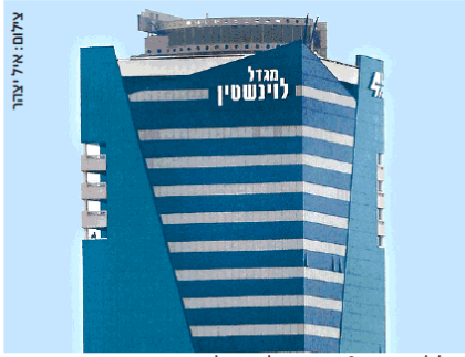
מגדל לוינשטיין בת"א. המניה עלתה מעל 60% בשנה האחרונה

מקצה 6.25% למגורה מבטחים ואלטשולר שחם - בעלי עניין בחברת הנדל"ן המניב - בחלקים שווים